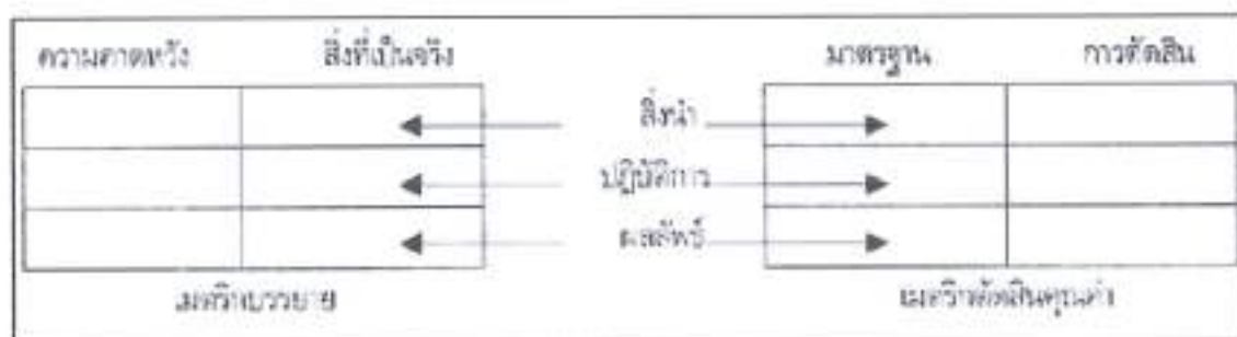
แผนภาพ Stake's Countenance Model

ดังนั้น การประเมินโครงการจึงต้องมีการบรรยายเกี่ยวกับโครงการอย่างละเอียดเพื่อให้ครอบคลุมถึงสารสนเทศที่จะต้องสนองความต้องการของผู้เกี่ยวข้อง เพื่อจะนำไปสู่การตัดสินใจเกี่ยวกับโครงการนั้น จึงเสนอรูปแบบของการประเมินโครงการอย่างมีระบบ โดยการบรรยายและตัดสินใจคุณค่าเกี่ยวกับโครงการตามหลักการของโครงการนั้นๆ Robert E. Stake ได้ตั้งชื่อแบบจำลองในการประเมินผลว่าแบบจำลองการสนับสนุน (Countenance Model) ดังแสดงในแผนภาพนี้